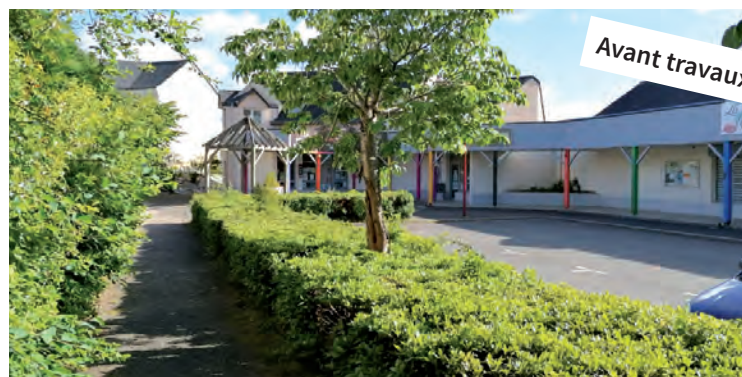
La Place des Jardinets avant les travaux