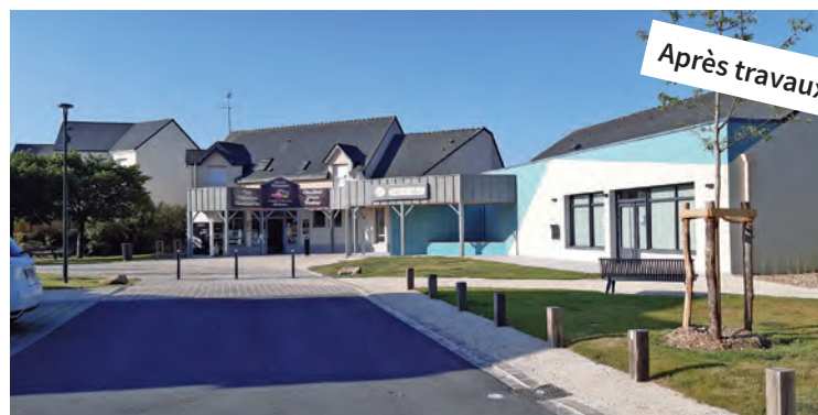
La Place des Jardinets à Saint-Léger-des-Bois réaménagée