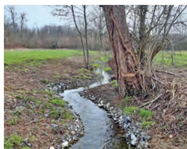
2 - Recharge granulométrique sous forme de banquettes - Exemple de mise en œuvre (SMBVAR)

Un décaissement des berges est prévu le long du chemin des Brosses et au niveau de la station d'épuration, le long du chemin communal, avec pour objectif de maîtriser les inondations en permettant le débordement du cours d'eau sur des parcelles enherbées plutôt qu'au niveau du lotissement.