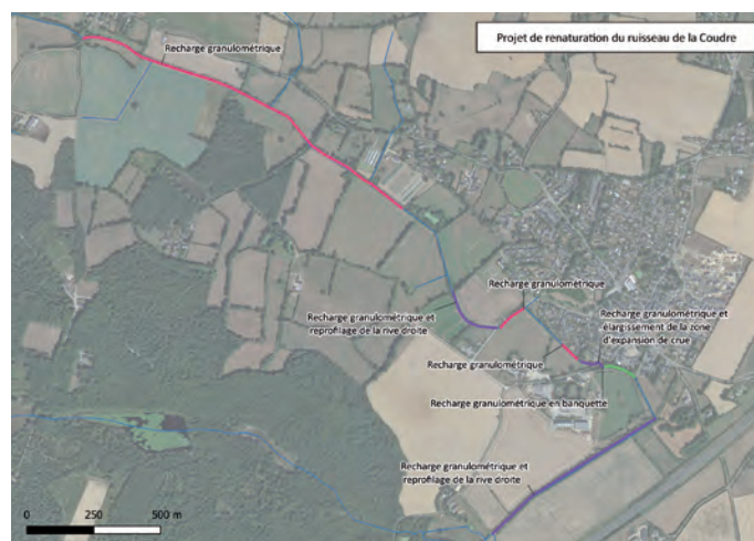
3 - Détail des travaux prévus selon les secteurs

Un décaissement des berges est prévu le long du chemin des Brosses et au niveau de la station d'épuration, le long du chemin communal, avec pour objectif de maîtriser les inondations en permettant le débordement du cours d'eau sur des parcelles enherbées plutôt qu'au niveau du lotissement.