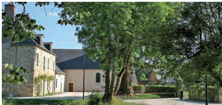
Clos du presbytère réaménagé à Saint-Jean-de-Linières