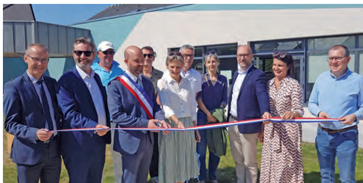
Inauguration de la Place des Jardinets/Espace vert du Brossais/et de la Bibliothèque à Saint-Léger-des-Bois